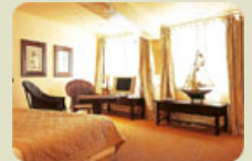
Les Maisons de Léa