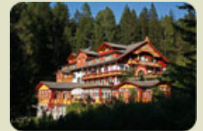
Parkhotel Sole Paradiso