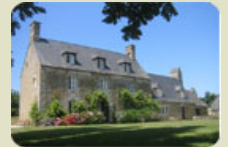
Domaine de Belleville