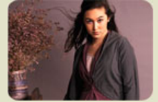
Gilet silver Sobosibio