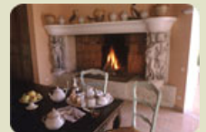
La Bergerie de l'Étang

Découvrez plus de 1800 adresses de charme en Europe avec notre partenaire